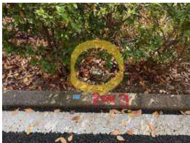
基準点 ( 0m )