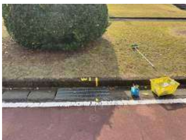
女子第 1 中継所 ( 800m )