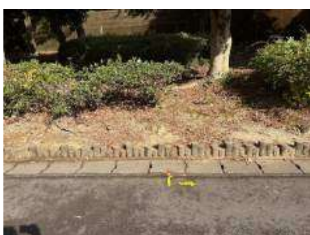
女子第 4 中継所 ( 2400m )