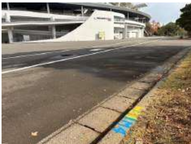
男子第 4・女子第 3 中継所 ( 400m )