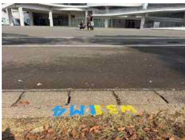
男子第 4 ・ 女子第 3 中継所 ( 400m )