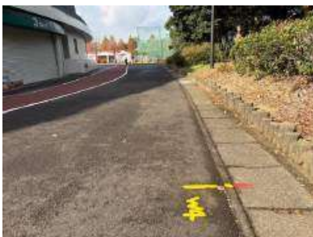
女子第 4 中継所 ( 2400m )