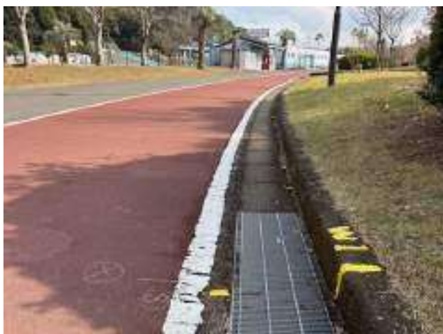
女子第 1 中継所 ( 800m )