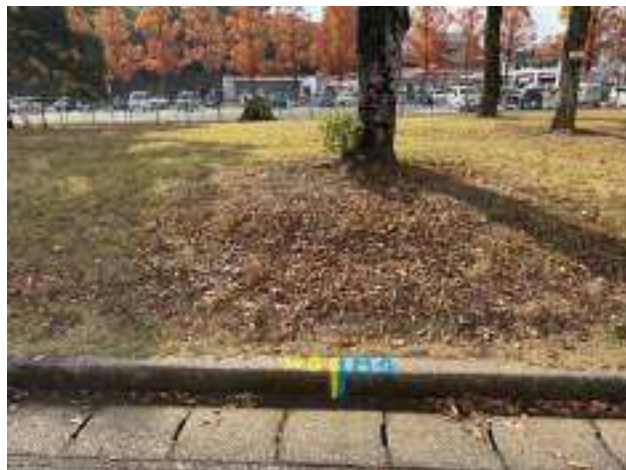
男子第 4・女子第 3 中継所 ( 400m )