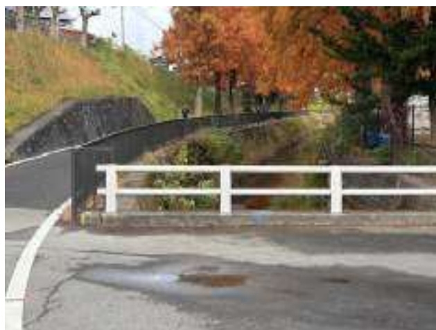
男子第 2 中継所 ( 200m )