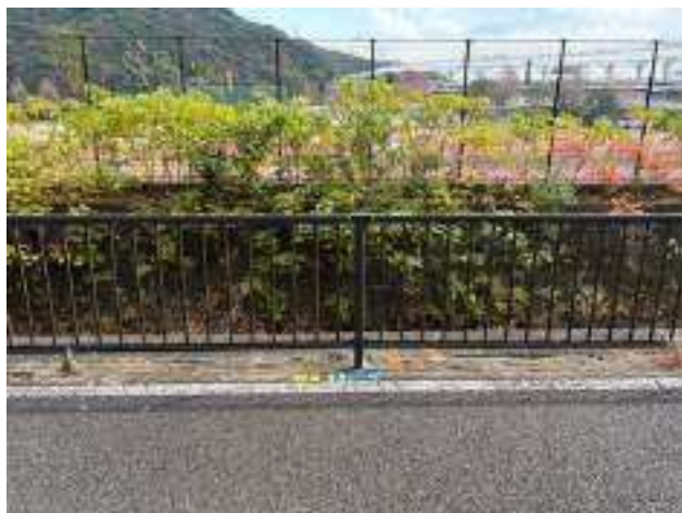
男子第 3 ・ 女子第 2 中継所 ( 100m )