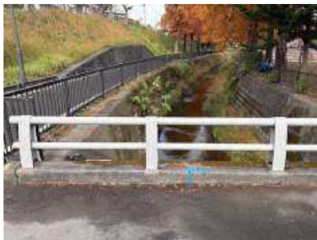
男子第 2 中継所 ( 200m )