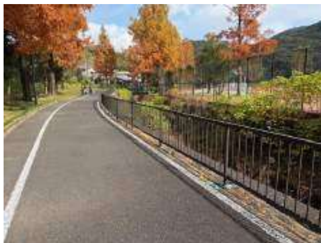
男子第 3 ・ 女子第 2 中継所 ( 100m )